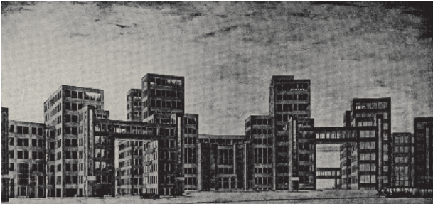
Derzhprom-Komplex am Platz der Freiheit in Kharkiv – Entwurfszeichnung, 1925

Der Krieg gegen die Ukraine bringt unfassbares Leid über die Menschen und zerstört Infrastrukturen und Kulturgüter. Die Baukultur der Moderne ist besonders betroffen. Aus diesem Anlass findet zur Triennale der Moderne 2022 in Berlin ein Themen-Schwerpunkt zu den Wurzeln und dem Erbe der Moderne in der Ukraine anhand von Kharkiv und Lviv statt.