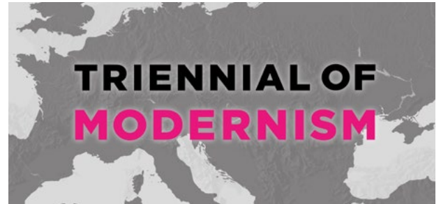
Visual zu der Europäischen Netzwerkarbeit

Die Moderne ist ein progressives Kulturerbe, dessen avantgardistische Architektur, Kunst, urbane und gesellschaftliche Entwicklungen für die Zukunft Europas und die Resilienz von Werten hochaktuell sind. Gemeinsam mit rund 40 Partner*innen aus rund 15 Ländern aus Mitteleuropa soll mit einem geplanten Europäischen Kooperationsprojekt der Weg